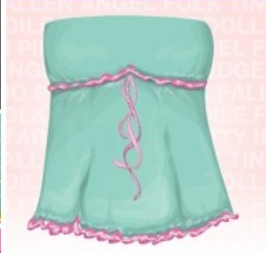
Pretty in Pink Ashley top