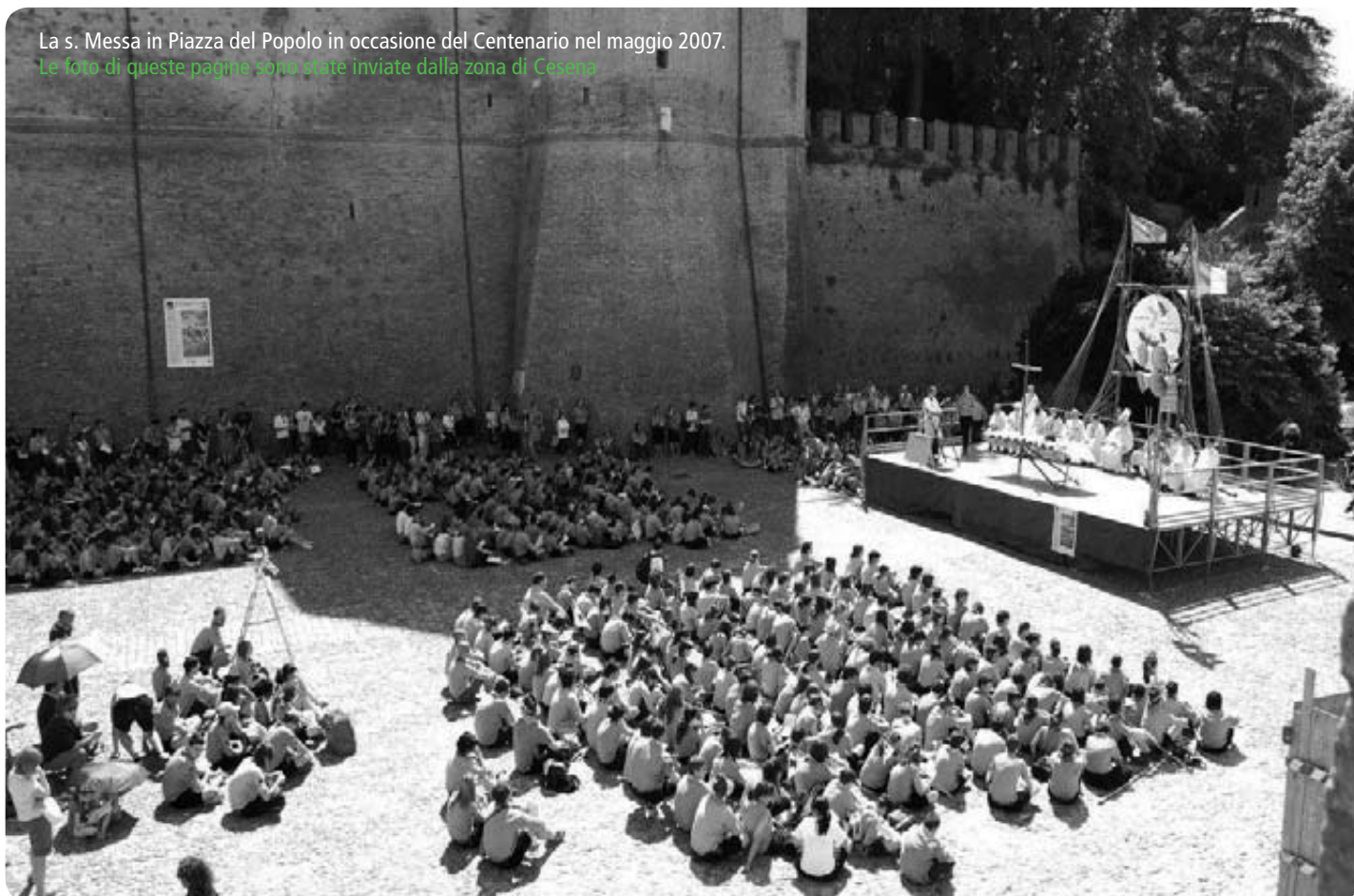
La s. Messa in Piazza del Popolo in occasione del Centenario nel maggio 2007. Le foto di queste pagine sono state inviate dalla zona di Cesena

Per quel che riguarda gli eventi per i capi, vengono organizzate due Assemblee di Zona all'anno, con modalità diverse di volta in volta (dalla pulizia del fiume Savio all'ascolto di testimonianze significative, al lavoro in gruppo divisi a volte per età, a volte, per Branchi, a volte per settore di interesse). Regolarmente le Branche si incontrano per momenti di formazione, non solo metodologici ma anche vocazionali in senso lato. Per i più capi giovani viene proposto un percorso specifico per