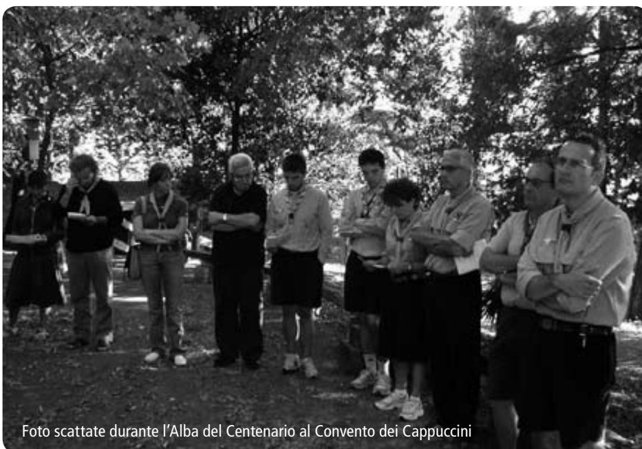
Foto scattate durante l'Alba del Centenario al Convento dei Cappuccini

I festeggiamenti del Centenario nel 2007 sono stati un'ottima occasione per stringere maggiormente il legame con l'Amministrazione Comunale e con la città in generale: la mostra fotografica sulla storia dello scautismo a Cesena, l'incontro pubblico a cui hanno partecipato Sindaco, Vescovo, il Capo Scout Eugenio Garavini e vecchi scout, il dono di cento volumi sullo scautismo alla Biblioteca Malatestiana di Cesena, la S. Messa in Piazza del Popolo, la decisione del Comune di intitolare un parco a Baden Powell sono stati momenti importanti per ribadire l'importanza dello scautismo per la città e rinsaldare il legame con i tanti fratelli cesenati che sono stati negli scout. Come Zona cerchiamo di essere presenti attivamente alla vita diocesana partecipando ai vari or-